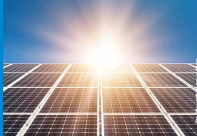
Lahr - Vielfalt im Quadrat

Energiewende selbst gemacht Finden Sie Ihr Haus unter www.lahr.de/solar